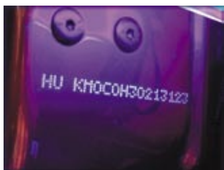
és UV-fénnyel megvilágítva

néhány partnerünk tesztjei alapján így sem mindig sikerül. Az eljárás fedőlakk nélküli fényezésén nem végezhető el, de a normál fényezésű gépkocsik a '90-es évek közepétől már fedőlakkal rendelkeznek.