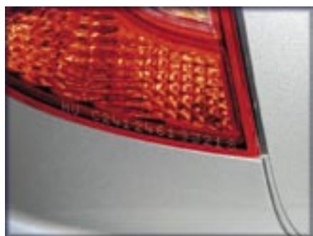
Példa az opcionális jelölésekre

A belső műanyag elemeket kék, illetve világos hangulatú belső esetén fehér