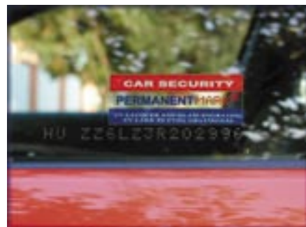
Az üveg esztétikus gravírozása

A PERMANENTMARK®-rendszerrel belegravírozható a gépjármű alvázszáma az összes üvegbe és a karosszériaelemek belső felületére (alpból 24 jelölés). Opcionálisan a lámpák, a könnyűfém felnik és a belső műanyagok is jelölhetők. A gravírozás nem egy egyszerű felületi jelölést jelent, hanem mély, kémiai maratást, mely csak a felület teljes rongálásával távolítható el. Az üveg jelölése esetén nem keletkeznek felületi mélyedések mint a homokfúvásos gravírozásnál, továbbá az