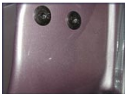
A jelölés normál fénynél,